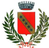
Comune di Remanzacco